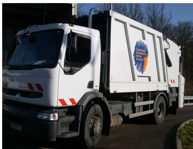
Véhicule de collecte